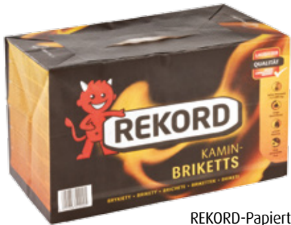
REKORD-Papiertüte / 10 kg Palette: 90 Tüten à 10 kg