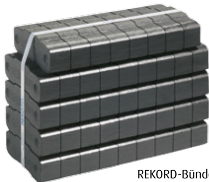
REKORD-Bündel / 25 kg Palette: 40 Bündel à 25 kg