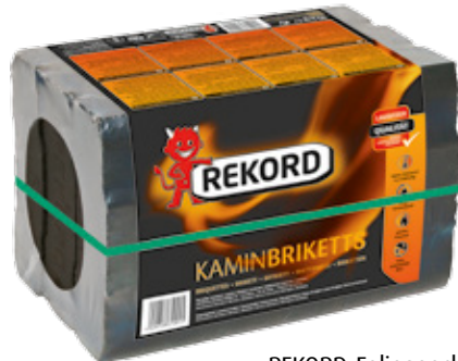
REKORD-Folienpack / 10 kg Palette: 90 Folienpacks à 10 kg