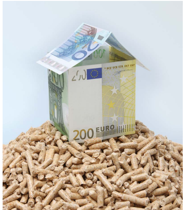
Auf Holzheizungen zu setzen lohnt sich auch finanziell.

In Verbindung mit den Höchstbeträgen förderfähiger Kosten ergeben sich aus den Fördersätzen für die energetische Modernisierung von Wohngebäuden inkl. Einbau einer Holzfeuerung die folgenden Förderhöchstbeträge: