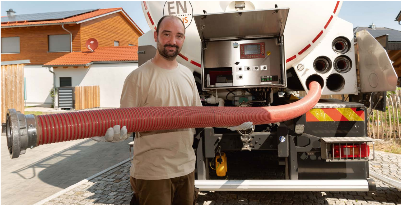
Holzpellets werden „getankt“ wie Heizöl – im Gegensatz zu dem fossilen Brennstoff sind sie aber klimafreundlich und im Schnitt deutlich günstiger.

ausreichend gedämmt werden. Nur dann kann man für sie eine Förderung als Effizienzgebäude oder Effizienzhaus erhalten. Welche Investitionsmaßnahmen hierfür neben der Investition in eine neue Heizung umgesetzt werden müssen, erläutern die Energie-Effizienz-Experten (EEE), die für die Umsetzung solcher Projekte ohnehin benötigt werden.