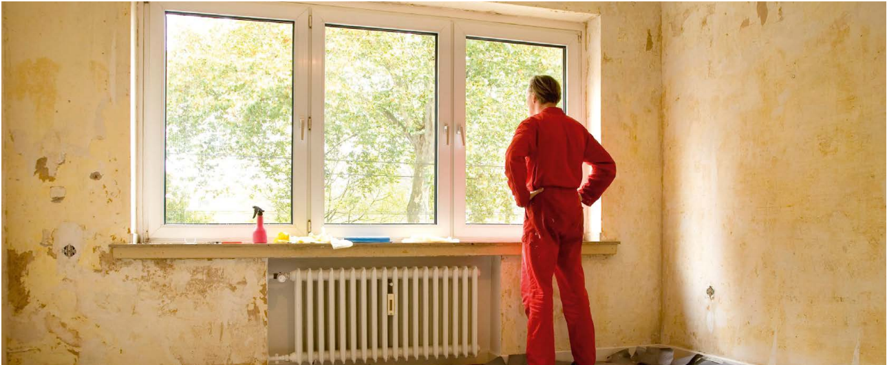
30–70 Prozent Zuschuss gibt es für den Umstieg auf eine moderne Holzheizung.

Im Programmteil Einzelmaßnahmen der Bundesförderung für effiziente Gebäude (BEG EM) kann eine Förderung für den Heizungstausch mit Holzfeuerungen im Gebäudebestand beantragt werden. Das gilt sowohl für neue Zentralheizungen mit Holz als auch für wasserführende Pelletkaminöfen.