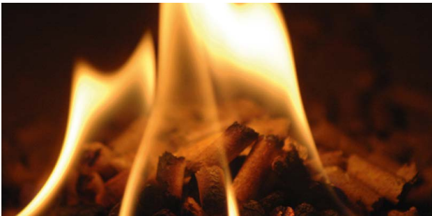
Sauber: Pellets verbrennen klimaneutral und nahezu rückstandsfrei.

D eutschlandweit werden mehr als 720.000 Gebäude von Haushalten, Kommunen, Gewerbetreibenden und Wohnungsunternehmen ganz oder teilweise mit dem klimafreundlichen Brennstoff Holzpellets beheizt.