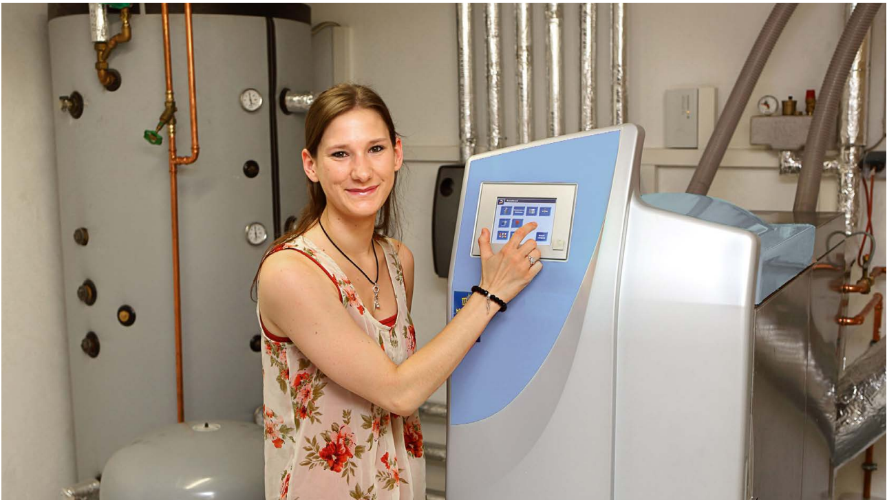
Moderne Holzheizungen sind nicht nur äußerst effizient und wartungsarm. Sie lassen sich auch ganz einfach steuern.

D ie Kreditanstalt für Wiederaufbau (KfW) fördert die umfassende energetische Modernisierung von Bestandsgebäuden (Effizienzhäuser bzw. Effizienzgebäude) im Rahmen einer „systemischen Förderung“. Gefördert wird auch der Ersterwerb dieser Gebäude.