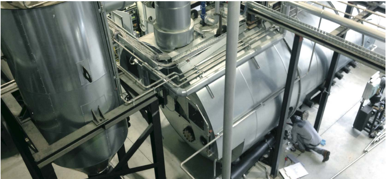
Großanlagen zur Prozesswärmeerzeugung – Beispiel hierfür die Güldenkron Fruchtsaft GmbH in Nistertal.

M it dem Förderprogramm „Energie- und Ressourceneffizienz in der Wirtschaft – Zuschuss und Kredit“ werden im Modul 2 „Förderung von Prozesswärmeerzeugern“ Holzkessel gefördert, die mehr als 50 Prozent Prozesswärme bereitstellen. Dabei gibt es sowohl eine Kredit- als auch eine Zuschussförderung in gleicher Höhe. Die Kreditförderung wird von der KfW (KfW-Programm 295) gewährt. Investitionszuschüsse für Investoren, die keinen Kredit benötigen, wickelt das BAFA ab.