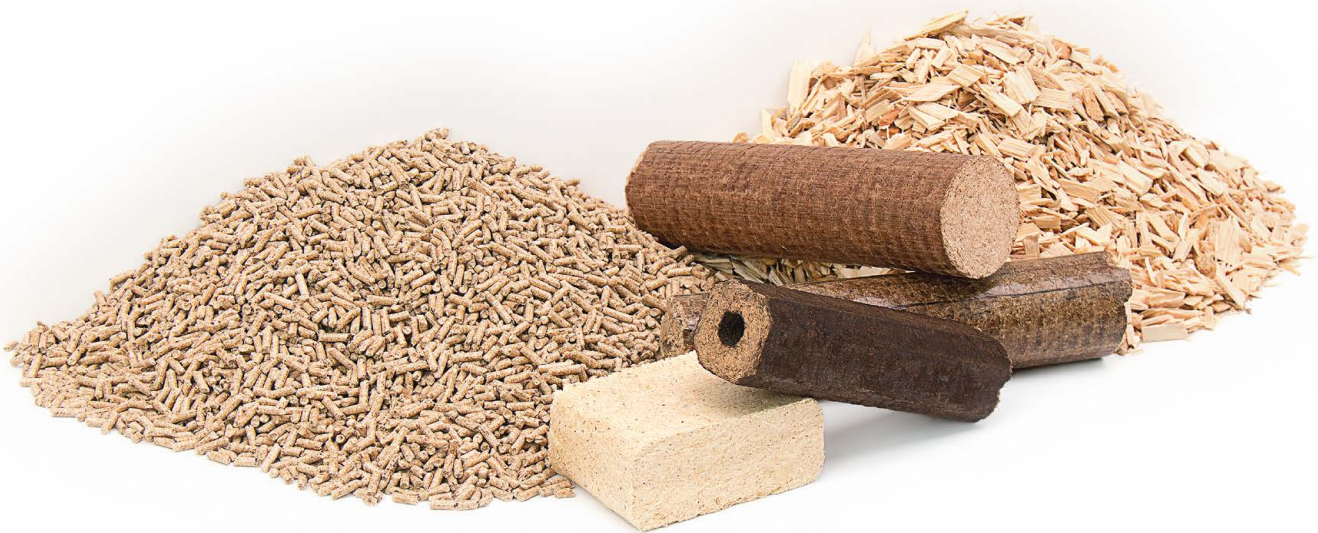
Moderne Holzenergie in Form von Pellets, Briketts und Hackschnitzeln.

Heizungsanlage oder den Anteil Erneuerbarer Energien zu erhöhen. Selbstnutzende Eigentümer können in diesem Fall alternativ auch die Steuerförderung für energetische Gebäudemodernisierung nutzen, die im Jahr nach der Installation mit der Steuererklärung beantragt werden kann.